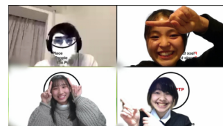
▲チームの皆との一枚

刺激を与えてくれた場所です。私は海外大学進学を希望しており、何か準備が出来ないかと思い参加したのが『TOPPA!!』でした。学校では教わることのないビジネス戦略や、大学だけではなく社会でも必要とされる能力を様々な経験を通してられた講師たちから学ぶことで、新たな視点からの課題解決が出来ました。長い期間を通して実施されたことで、多くの人と関与出来ただけでなく、自分自身の新たな課題点にも気付かされた三か月になりました。また、教わるだけでなくその都度、グループワークを設けてくれたことで実際に活用できる能力を得ることが出来たと実感しています。同じ志を持った同世代と共に学べたことは、今後の人生に繋がる素晴らしい経験だったと確信しています。（広島、高3）